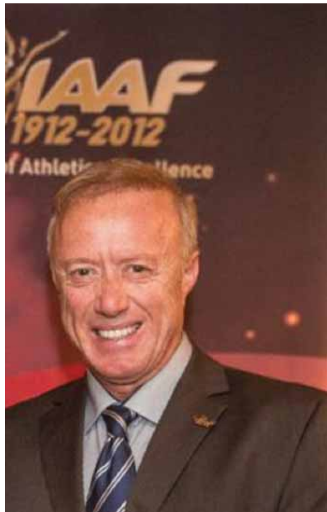
Ο Παναγιώτης Δημάκος εκλέχθηκε στο Συμβούλιο της Ευρωπαϊκής Ομοσπονδίας

«Είμαι πολύ ευτυχισμένος την σημερινή ημέρα. Θέλω να ευχαριστήσω τον πρόεδρο Κώστα Παναγόπουλο, τον γενικό γραμματέα Βασίλη Σεβαστή και όλο το συμβούλιο του ΣΕΓΑΣ, που μου έδωσαν την ευκαιρία να κατέβω υποψήφιος στις εκλογές της ΕΑΑ. Θέλω να ευχαριστήσω επίσης τους 40 από τους 50 εκπροσώπους των ευρωπαϊκών χωρών που με επέλεξαν. Ο ελληνικός στίβος μετά από χρόνια επιστρέφει στην διεθνή σκηνή. Θα κάνω ό,τι μπορώ για το καλύτερο του ελληνικού, αλλά και του ευρωπαϊκού στίβου».