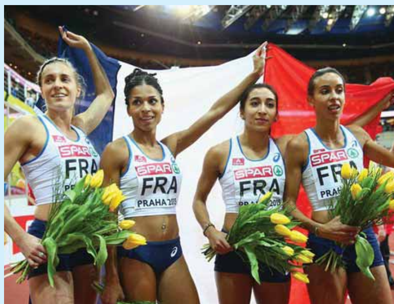
Η ομάδα σκυταλοδρομίας της Γαλλίας