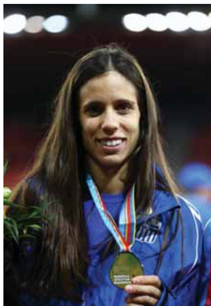
Η Κατερίνα Στεφανίδου

Π έρασαν αρκετά χρόνια μέχρι να ξαναβρεθεί Έλληνας αθλητής στο βάθρο Ευρωπαϊκού Πρωταθλήματος κλειστού στίβου. Ο τελευταίος που τα είχε καταφέρει, ήταν ο Λούης Τσάτουμας, όταν το 2007 στο Μπέρμιγχαμ είχε πάρει το αργυρό μετάλλιο. Αλλά η Κατερίνα Στεφανίδου με τον Αντώνη Μάστορα φρόντισαν να επαναφέρουν την Ελλάδα στον πίνακα μεταλλίων της διοργάνωσης. Μετά από την ξηρασία τριών διοργανώσεων, σε Τορίνο, Παρίσι και Γκέτεμποργκ, οι δύο άλλτες επανέφεραν την Ελλάδα στο βάθρο, με την κατάταξη να καταλαμβάνει της 12ης θέσης στον πίνακα μεταλλίων, χάρη στα δύο αργυρά που κατέκτησαν σε επί κοντώ και ύψος. Έτσι, πλέον στην ελληνική συλλογή μεταλλίων από τη συγκεκριμένη διοργάνωση υπάρχουν πλέον 26 με αυτό της Στεφανίδου να είναι το πρώτο ελληνικό στο επί κοντώ. Στην κορυφή του πίνακα μεταλλίων