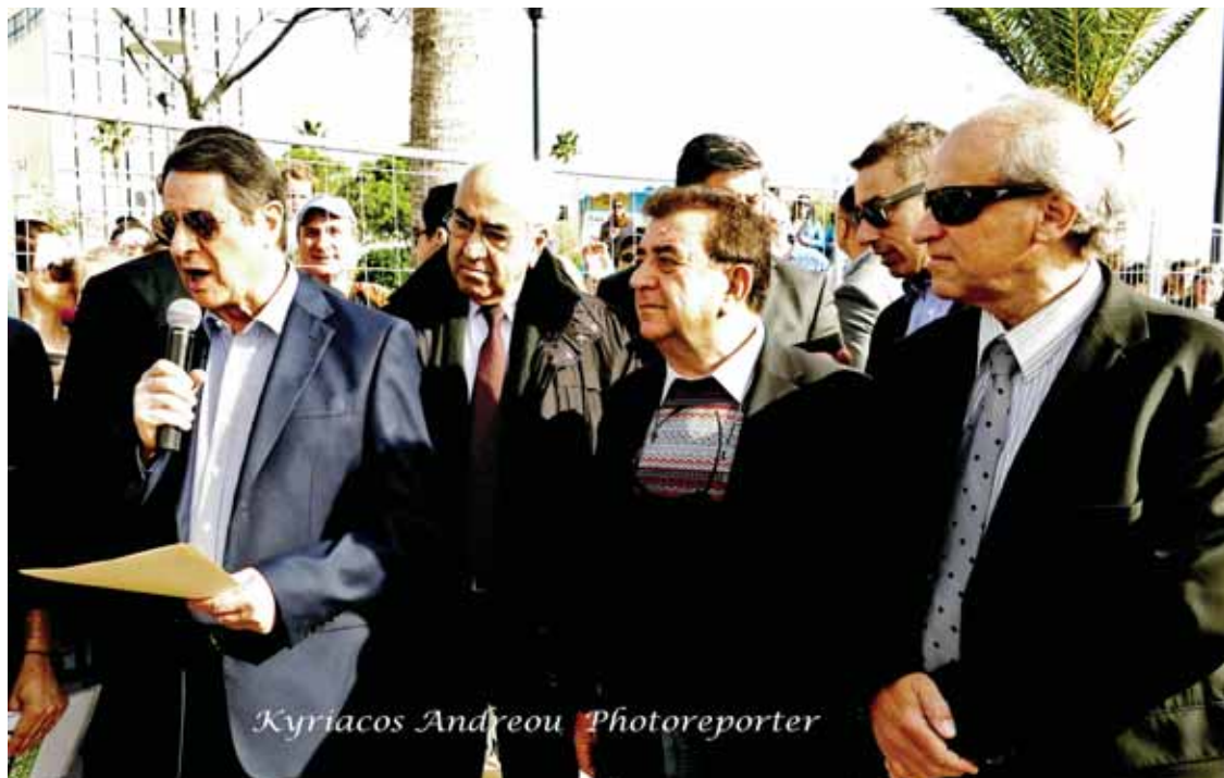
Ο πρόεδρος της Δημοκρατίας Νίκος Αναστασιάδης μιλά λίγο πριν από την έναρξη του Μαραθωνίου. Δίπλα του ο πρόεδρος του ΓΣΟ Νεοκλής Θωμά και ο Δήμαρχος Λεμεσού Ανδρέας Χρίστου