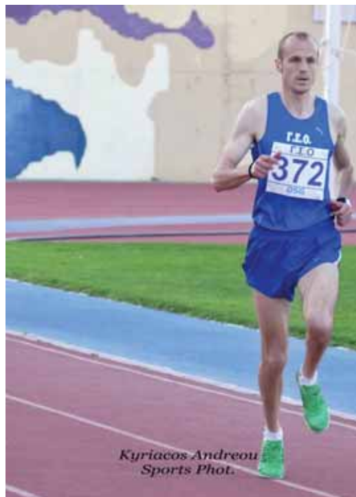
Ο Πούσκας του ΓΣΟ ήταν ο νικητής των 10.000μ.