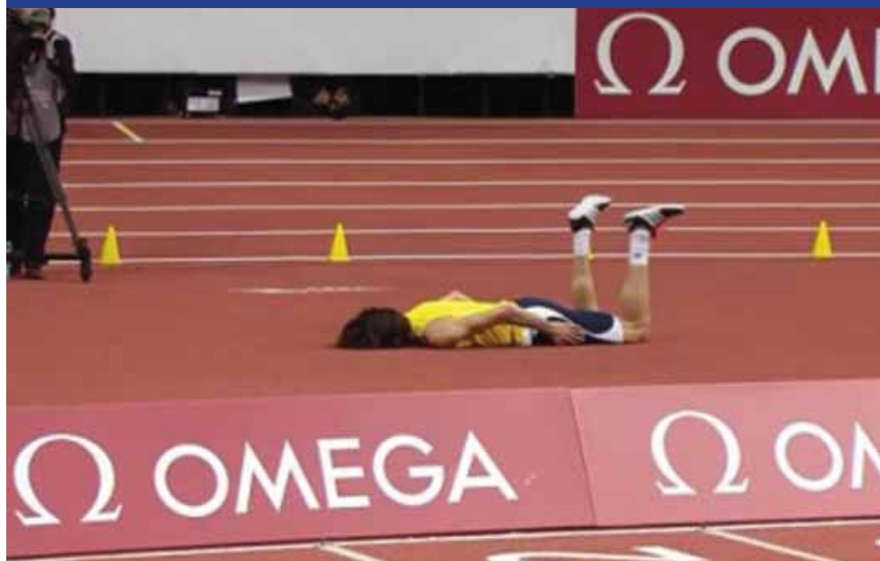
Ο Ιωάννου τραυματίζεται και πέφτει στο έδαφος