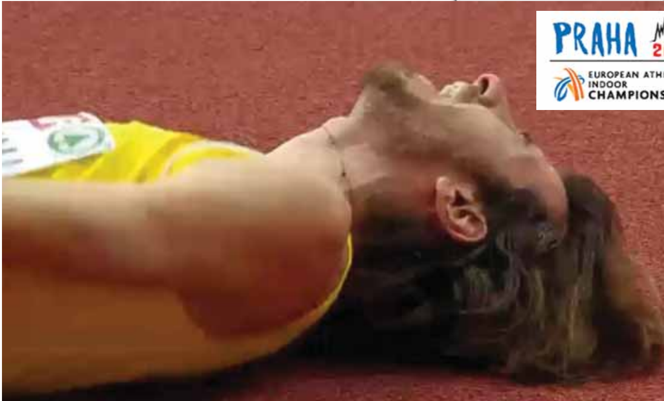
Ο πόνος από τον τραυματισμό είναι αφόρητος