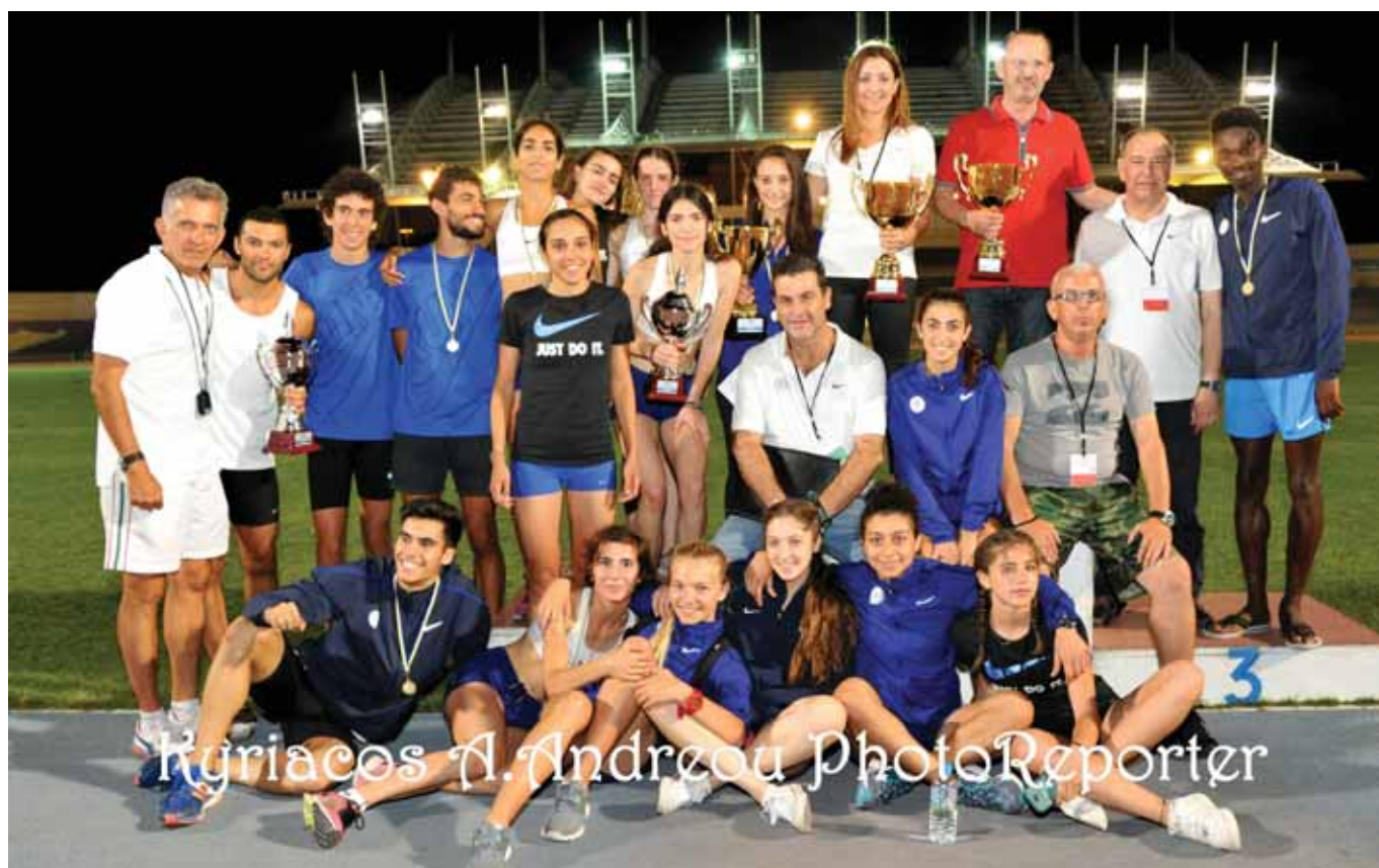
Οι αθλητές/τριες, προπονητές και παράγοντες του ΓΣΠ πανηγυρίζουν την κατάκτηση της πρώτης θέσης στους Παγκυπριούς Αγώνες Ανδρών και Γυναικών