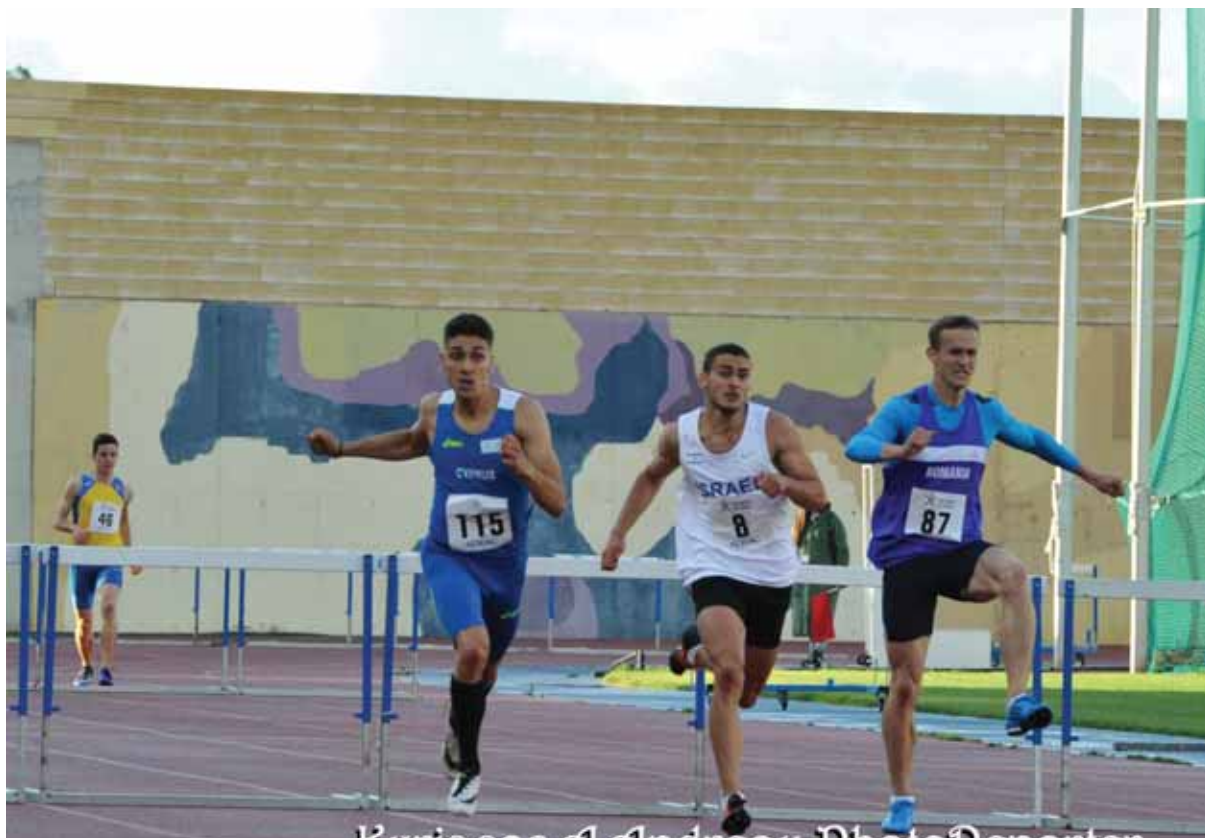
Στιγμιότυπο από το δρόμο των 110μ, εμποδίων