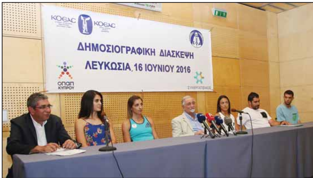
Στιγμιότυπο από τη διάσκεψη για τους Παγκύπριους Αγώνες. Ο πρόεδρος της ΚΟΕΑΣ μίλησε για τους Παγκύπριους και τους Ολυμπιακούς Αγώνες.