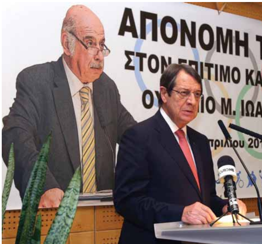
Ο Πρόεδρος της Δημοκρατίας μιλά στην τελετή βράβευσης.

Στην προσφώνηση του ο Πρόεδρος της Δημοκρατίας κ. Νίκος Αναστασιάδης αναφέρθηκε στην επιτυχημένη σταδιοδρομία του Ουράνιου Ιωαννίδη ως πολιτικού, εκπαιδευτικού και συγγραφέα, και στάθηκε ιδιαίτερα στο σημαντικό έργο που κατέγραψε στην Προεδρία του Εκτελεστικού Συμβουλίου της ΚΟΕ, περίοδο κατά την οποία η Κύπρος σημείωσε τις μεγαλύτερες επιτυχίες στον αθλητισμό συμπεριλαμβανομένης της κατάκτησης του πρώτου Ολυμπιακού μεταλλίου από τον Παύλο Κοντίδη : «Είναι ο επιστήμονας, ο φυσιογνώστης, ο βιολόγος, ο εξάιτετος