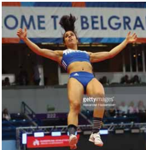
Η ελληνίδα Ολυμπιονίκης Κατερίνα Στεφανίδη κέρδισε το χρυσό μετάλλιο στο επι κοντώ.