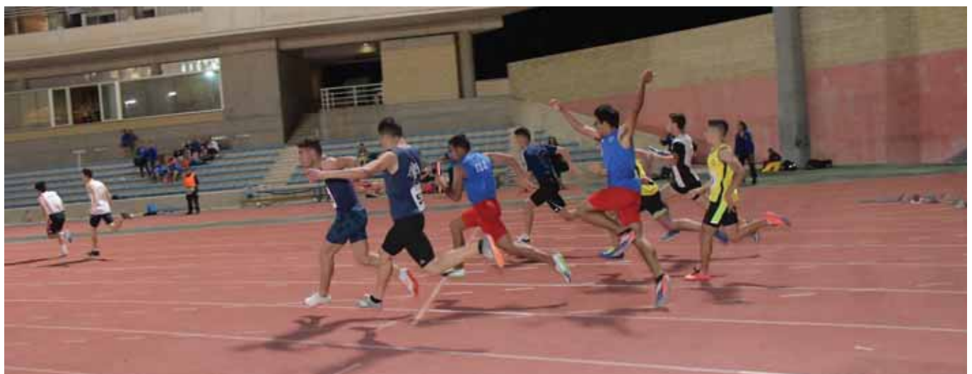
Στιγμιότυπο από το αγώνισμα σκυταλοδρομίας 4Χ100 εφήβων όπου πρώτευσε ο ΓΣΠ