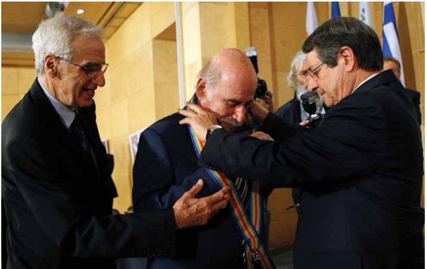
Ο Πρόεδρος της Δημοκρατίας Νίκος Αναστασιάδης απονέμει την Ανώτατη Διάκριση της ΚΟΕ

δράση του τιμώμενου. Όπως ανέφερε ο Ουράνιος Ιωαννίδης, δεν δίστασε ούτε μια φορά να αναλάβει καθήκοντα και ευθύνες αλλά και να ηγηθεί και να κατευθύνει οργανωμένα σύνολα, παραμένοντας πάντα αγνός και ανιδιοτελής, αγωνιστής της ζωής και της πατρίδας, κατ' εξακολούθηση δημιουργικός, απίστευτα προοδευτικός μα προπάντων ηθικός, αξιοπρεπής και ασυμβίβαστος.