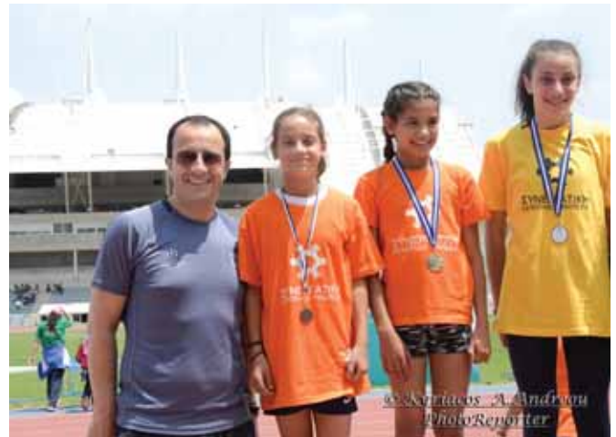
Ο Κυβερνητικός Εκπρόσωπος κ. Νίκος Χριστοδουλίδης με τη κόρη του Αικατερίνη αριστερά και τα άλλα κορίτσια που αγωνίστηκαν στα 75μ.

Εκ μέρους της ΚΟΕΑΣ παρευρέθηκε ο πρόεδρος κ. Αντώνης Δράκος. Τα πλήρη αποτελέσματα των αγώνων έχουν ως ακολούθως: