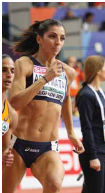
Η Αρτουμάτ έτρεξε 400μ.