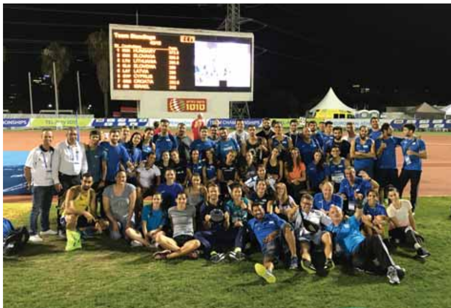
Η Κυπριακή αποστολή πανηγυρίζει μετά την επίτευξη του στόχου της και την παραμονή στη β' κατηγορία.

Το σήμερα είναι αρκετά ενθαρρυντικό για το μέλλον του κυπριακού στίβου, ο οποίος χρει-