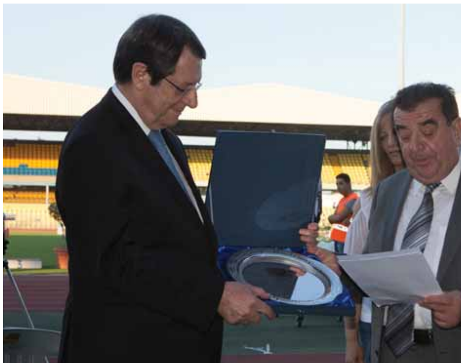
Ο πρόεδρος του ΓΣΟ κ. Νεοκλής Θωμά απονέμει τιμητική πλακέτα στον Πρόεδρο της Δημοκρατίας κ. Νίκο Αναστασιάδη.

Πολύ περισσότερο όμως στους Ολυμπιακούς Αγώνες του Ρίο, όπου για πρώτη φορά στην