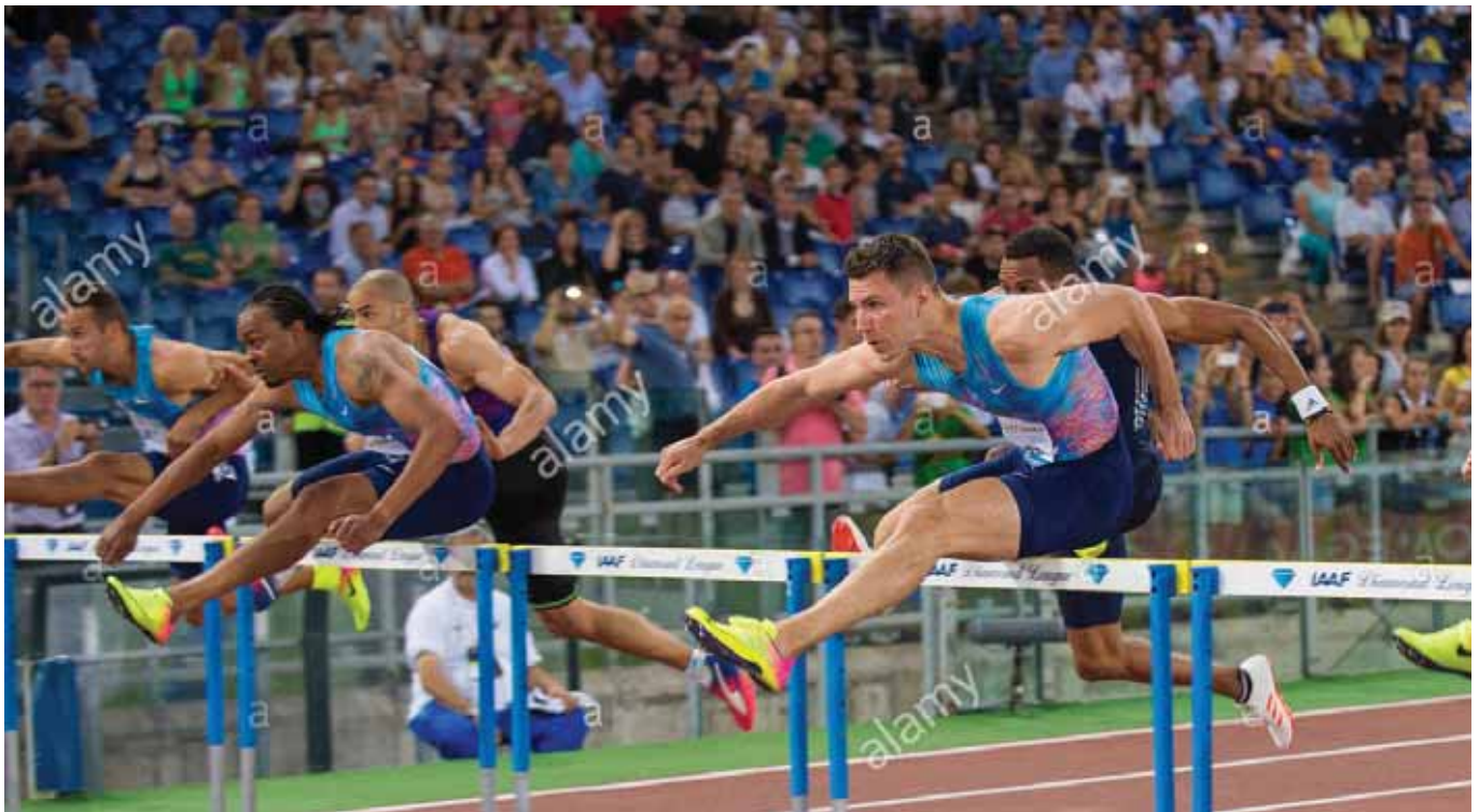
Ο Μίλαν Τραϊκόβιτς αριστερά στο γκαλά της Ρώμης. Πέτυχε χρόνο 13.39 και εξασφάλισε το όριο πρόκρισης για το Παγκόσμιο Πρωτάθλημα