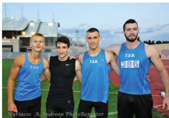
Η ομάδα σκυταλοδρομίας του ΓΣΟ ήταν η νικήτρια στα 4Χ400Μ.