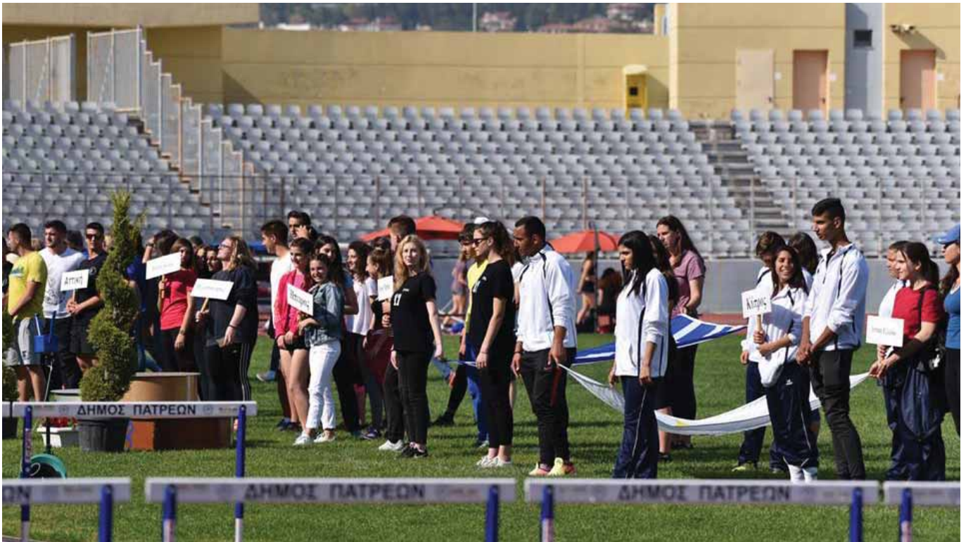
Στιγμιότυπο από την παρέλαση αθλητών-τριών στους Πανελλήνιους Μαθητικούς Αγώνες που διεξήχθησαν στην Πάτρα