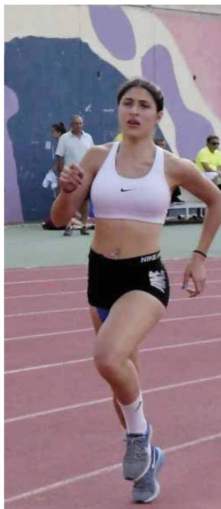
Η Χαριθέα Ηρακλέους του ΓΣΟ νικήτρια του Επτάθλου