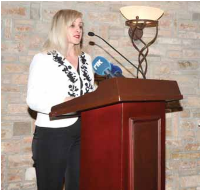
Η αναπληρώτρια κυβερνητική εκπρόσωπος Κλέλια Βασιλείου

Χαιρετισμός Υπουργού Παιδείας και Πολιτισμού Δρα Κώστα Χαμπιαούρη εκ μέρους του Προέδρου της Κυπριακής Δημοκρατίας, στην απονομή ανώτατης διάκρισης της «Χρυσής Νίκης» στον Επίτιμο Πρόεδρο της ΚΟΕΑΣ κ. Αντώνη Δράκο