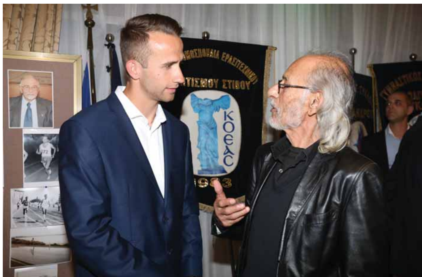
Δύο ολυμπιονίκες σε διαφορετικές εποχές. Ο Σταύρος Τζιωρτζής στο Μόναχο και Μίλαν Τραϊκοβίτς στο Ρίο. Ο πρώτος στα 400μ. εμπόδια και ο δεύτερος στα 110μ. εμπόδια