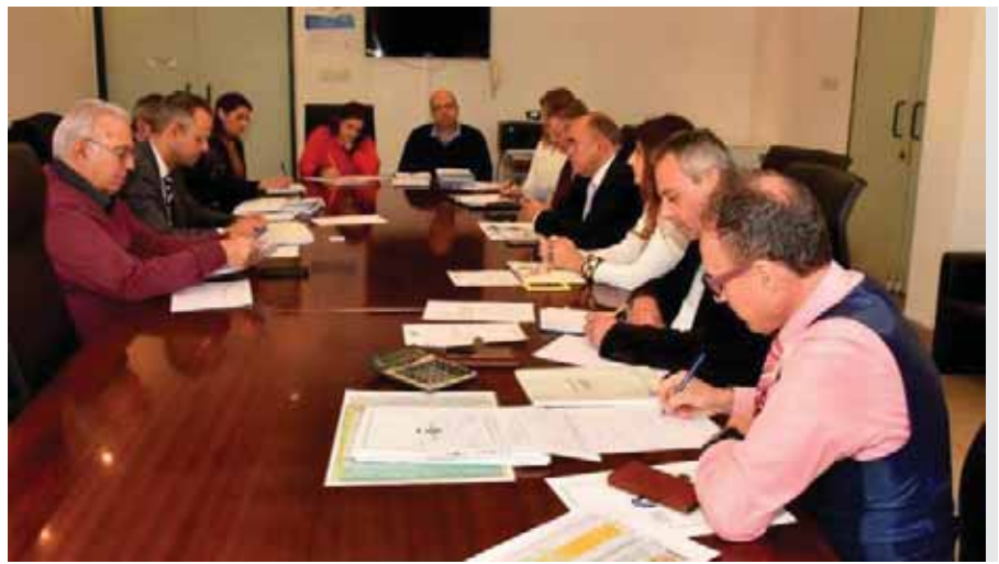
Στιγμιότυπο από τη συνάντηση ΚΟΕΑΣ-ΚΟΑ

συζήτησης τόνισε ότι ο στόχος του νέου Δ.Σ. είναι πάντοτε μέσα στα πλαίσια της πλήρους διαφάνειας, να πάει ο αθλητισμός ακόμα ένα βήμα παραπέρα: «Είμαστε μαζί σας. Θέλουμε να πάρουμε τον αθλητισμό ακόμα ένα βήμα παραπέρα. Να αγγίξουμε τους αθλητές και τους προπονητές με προοπτική».