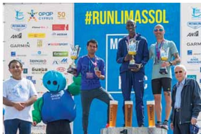
Οι νικητές του διεθνούς μαραθωνίου δρόμου ΓΣΟ Λεμεσού