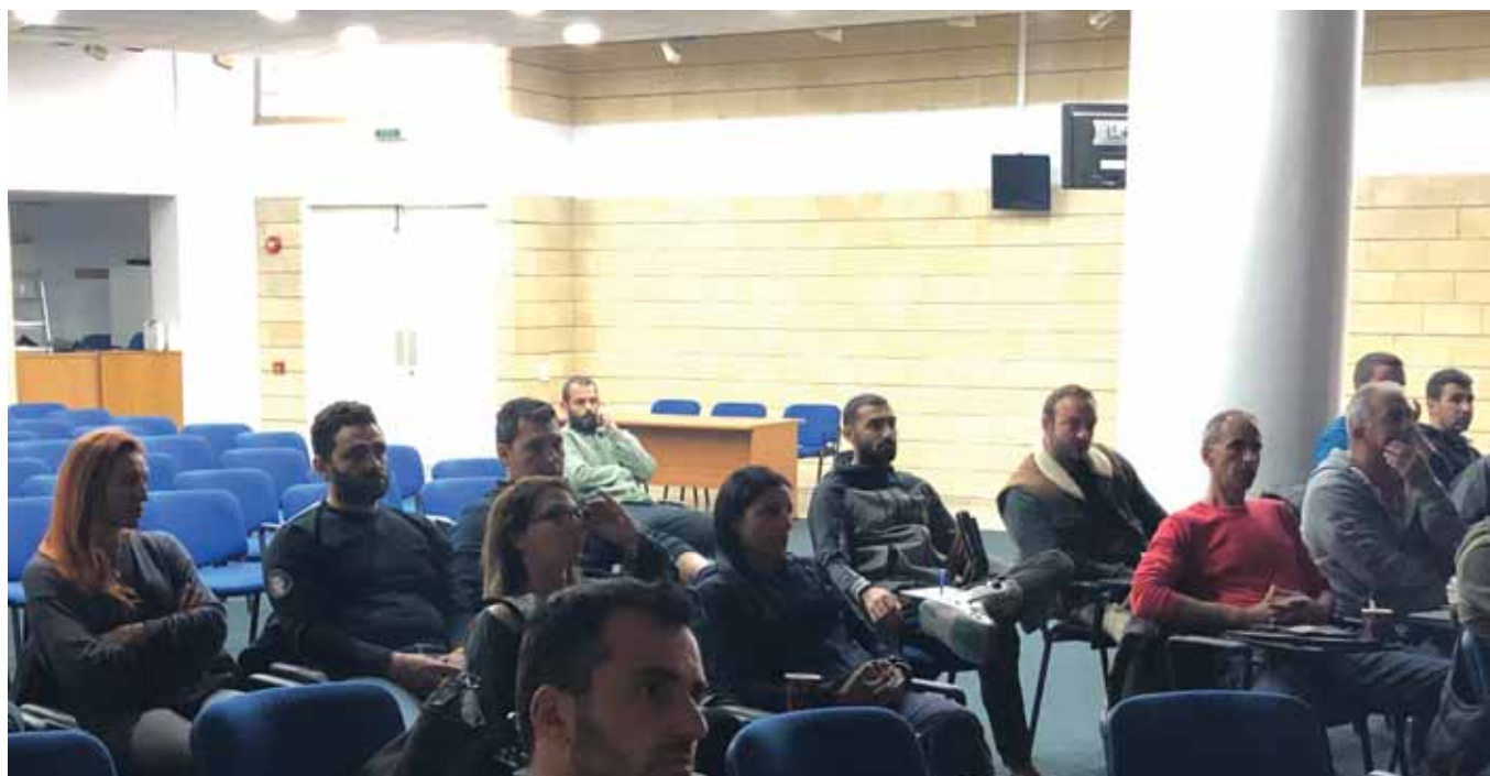
Οι προπονητές που παρακολούθησαν το σεμινάριο