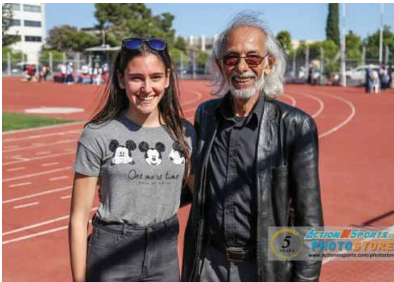
Ο Κύπριος Ολυμπιονίκης στα χαμηλά εμπόδια του Μονάχου 1972 Σταύρος Τζιωρτζής με την τωρινή πρωταθλήτρια στο ίδιο αγώνισμα Ελεάνα Χριστοφή του Γ.Σ.Πραξάνδρου.