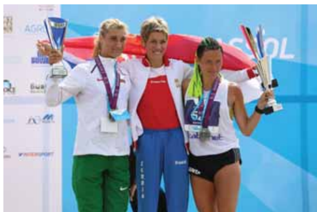
Οι νικήτριες του διεθνούς μαραθωνίου δρόμου ΓΣΟ Λεμεσού