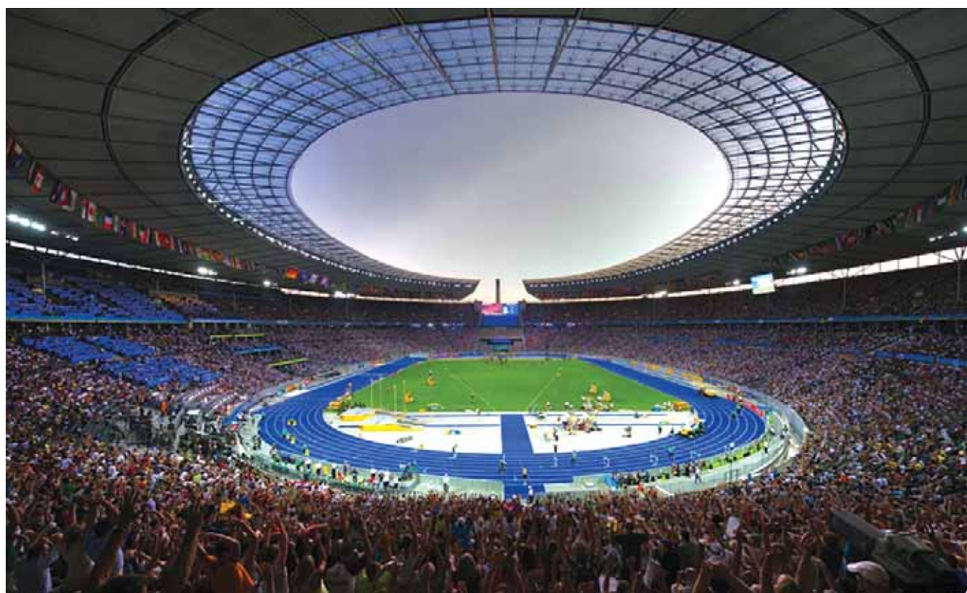
Το Ολυμπιακό Στάδιο του Βερολίνου όπου διεξήχθησαν οι αγώνες