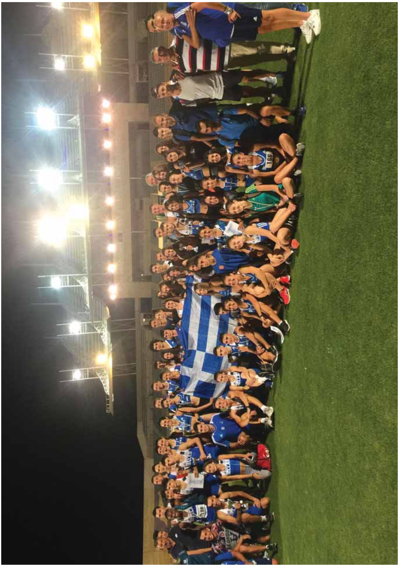
Οι αθλητές, αθλήτριες, προπονητές και παράγοντες της Ελλάδας πανηγυρίζουν για τη νίκη στην αθλητική συνάντηση Παιδων - Κορασίδων με την Κύπρο που διεξήχθη στο Εθνικό Στάδιο Στίβου στη Λευκωσία