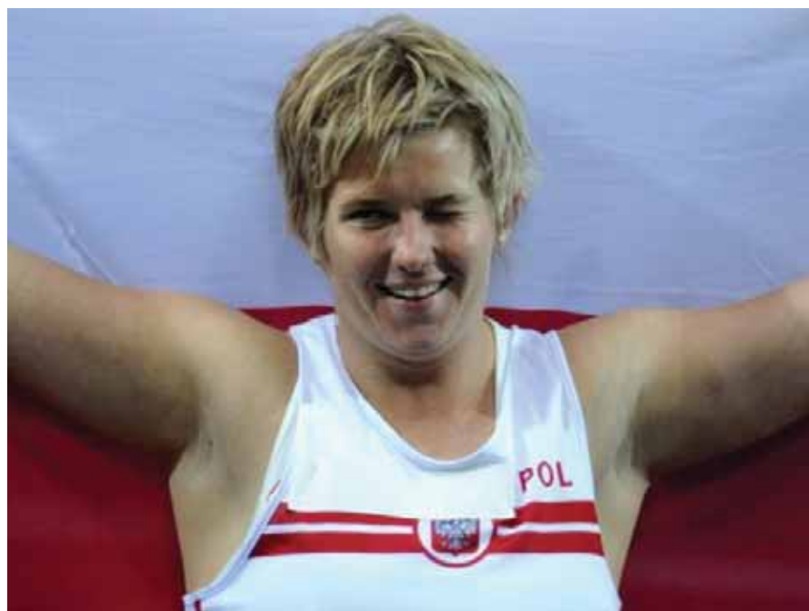
Η Ανίτα Βλόνταρτσικ από την Πολωνία κατέκτησε το χρυσό μετάλλιο στη σφυροβολία