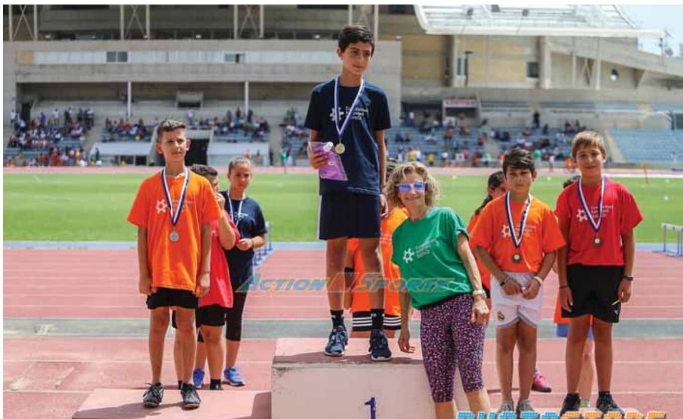
Μαζική ήταν η συμμετοχή των μικρών αθλητών, αθλητριών στους αγώνες του ΕΣΥΑΑ. Μέσα από αυτή την πλειάδα θα αναδειχθούν τα ταλέντα που με την ειδική προπόνηση θα ενισχύσουν τους Συλλόγους και τις Εθνικές ομάδες.