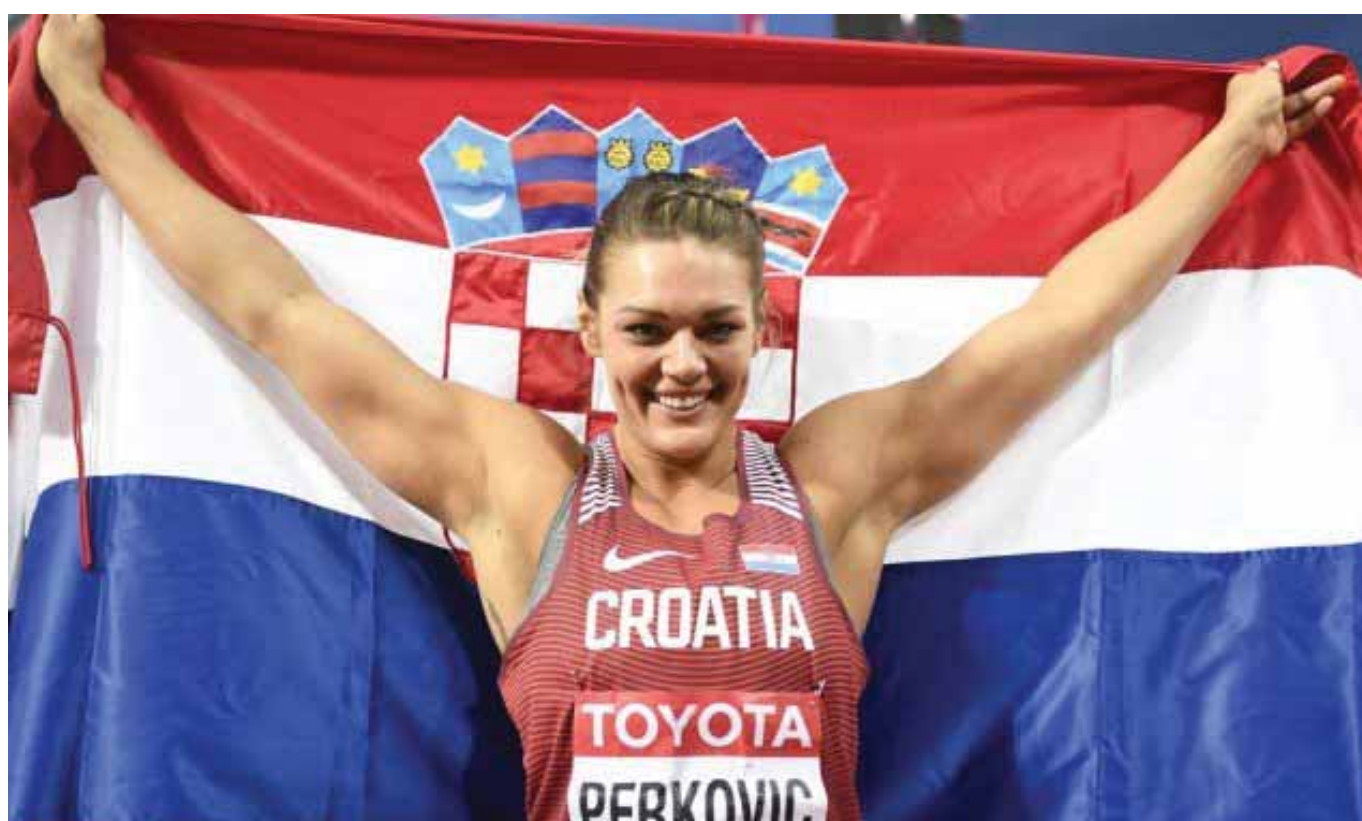
Η Σάντρα Πέρκοβιτς από την Κροατία κατέκτησε το χρυσό στη δισκοβολία